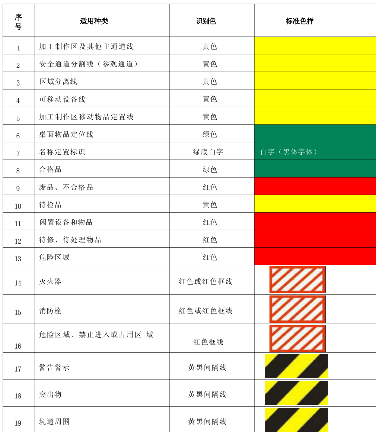
表 C.1 标识线颜色